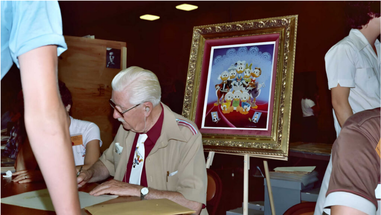
Carl Barks auf der San Diego Comic Con 1982