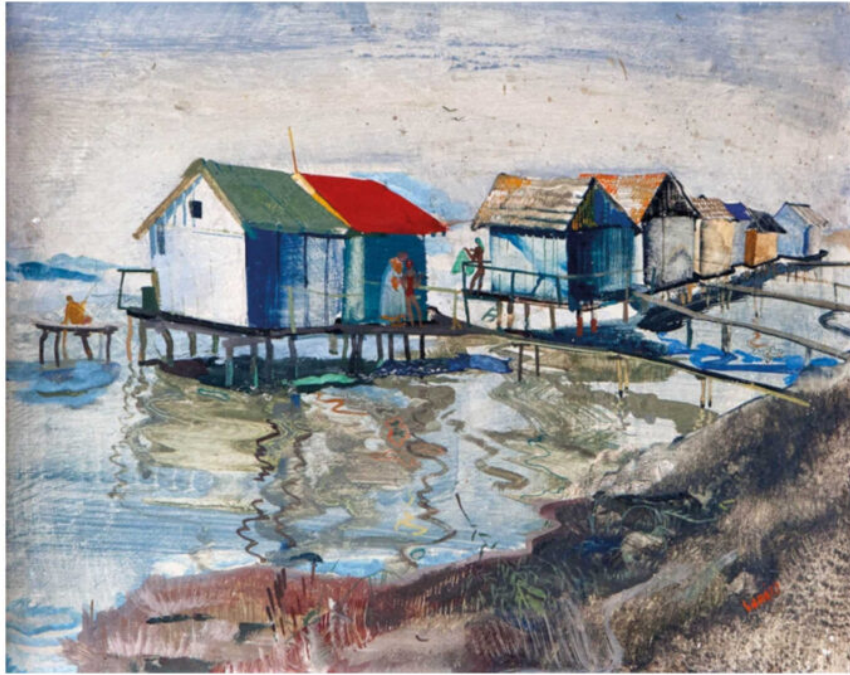
Endre Vadász: Badehäuser , Tempera auf Holz

Bild: Endre Vadász , Public domain, via Wikimedia Commons